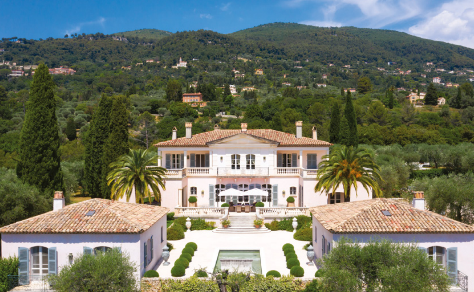
V2480VA | VILLA - VALBONNE

LES PLUS BELLES TRANSACTIONS PORTENT TOUJOURS LA MÊME SIGNATURE