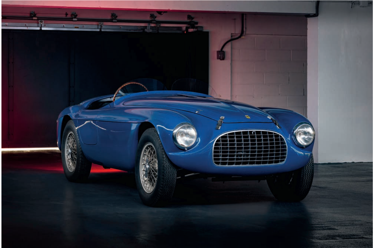
951 Ferrari 340 America Barchetta Touring Superleggera Vendue 5 706 000 € à Rétromobile 2023