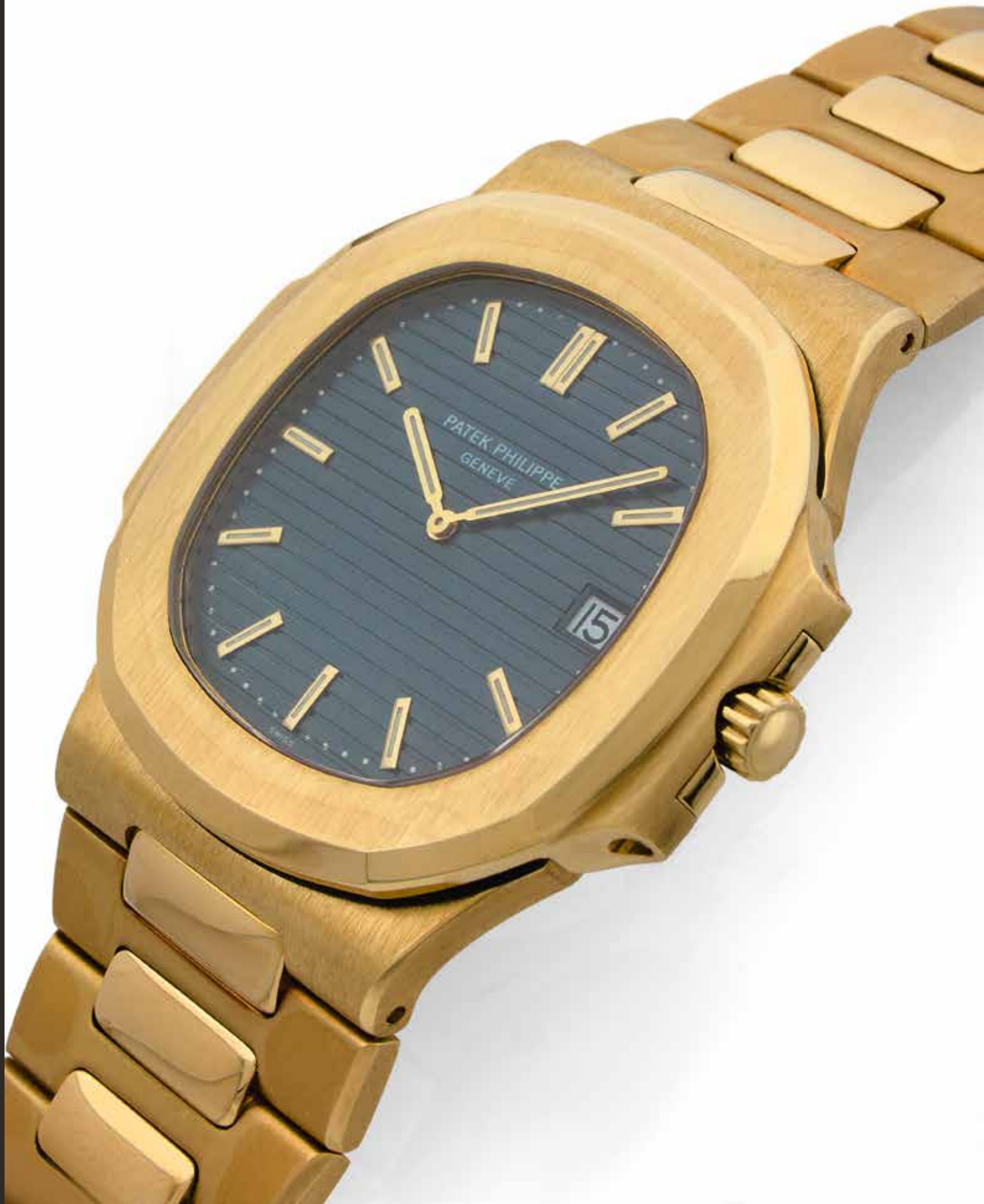
lot n°49, Patek Philippe, Nautilus, ref. 3700/1J, n° 1307047, Vers 1978 (détail) p.54