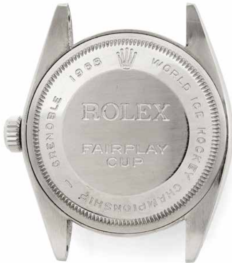
lot n°44, Rolex, «Fair Play Cup» Jeux Olympiques d'Hiver, Grenoble 1968 Oyster Perpetual Date, ref. 1500, n°1550248, vers 1967 p.42