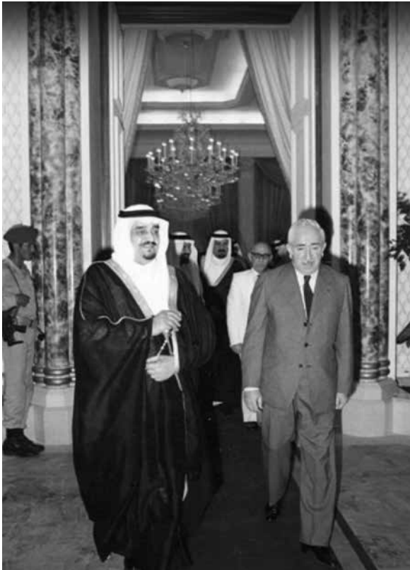
Rachid Karamé et le roi d'Arabie Saoudite lors de leur dernière rencontre en 1984

Day Date «The Eastern Arabic», ref. 6613B, n° 403672, vers 1958 Pièce historique