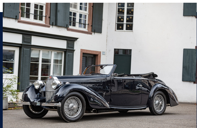
1936 BUGATTI TYPE 57 STELVIO PAR GANGLOFF Estimation : 600 000 - 800 000 €