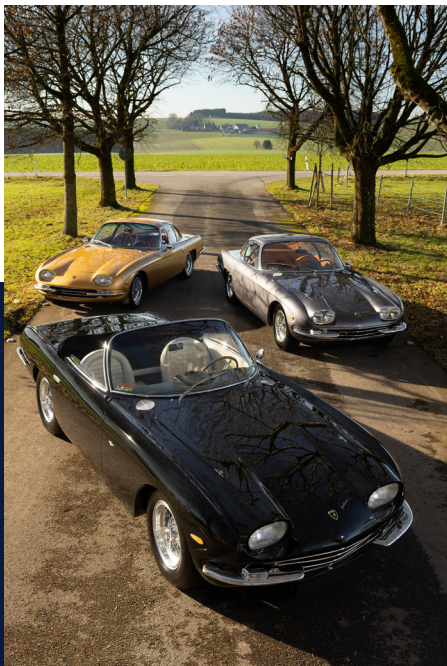
THE GT LAMBORGHINI COLLECTION